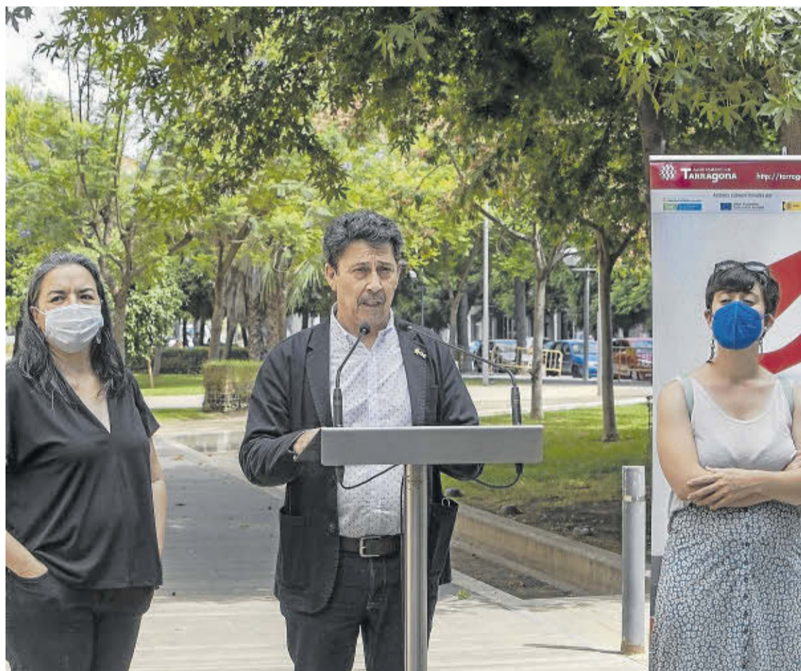
El concejal de Ocupació compareció junto a las asesoras responsables del servicio.

Las consultas serán presenciales y 'on line' y ofrecerá asesoramiento gratuito a los ciudadanos y emprendedores de la ciudad