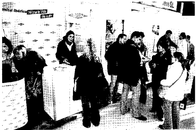
L'afluència dels alumnes als diversos estands és contínua. La imatge és de l'edició anterior.

El dijous dia 18, la ponència del matí, a les 9 hores, es titula Les com-