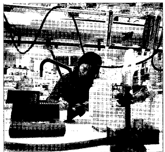
Laboratoris de la Facultat d'Enologia.