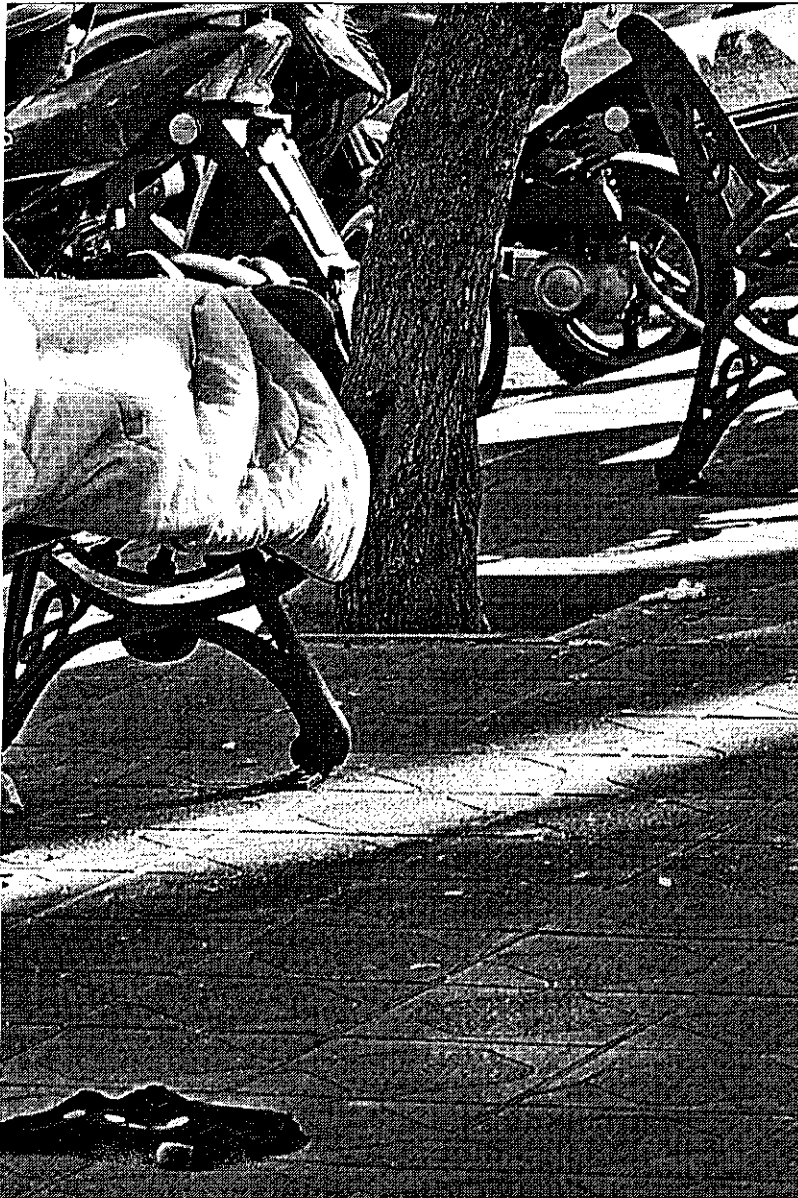
El estudio no incluye a las personas sin techo, ya que se concreta en la pobreza según los distintos tipos de hogar y familia.

de los encuestados no puede ir de vacaciones por motivos económicos