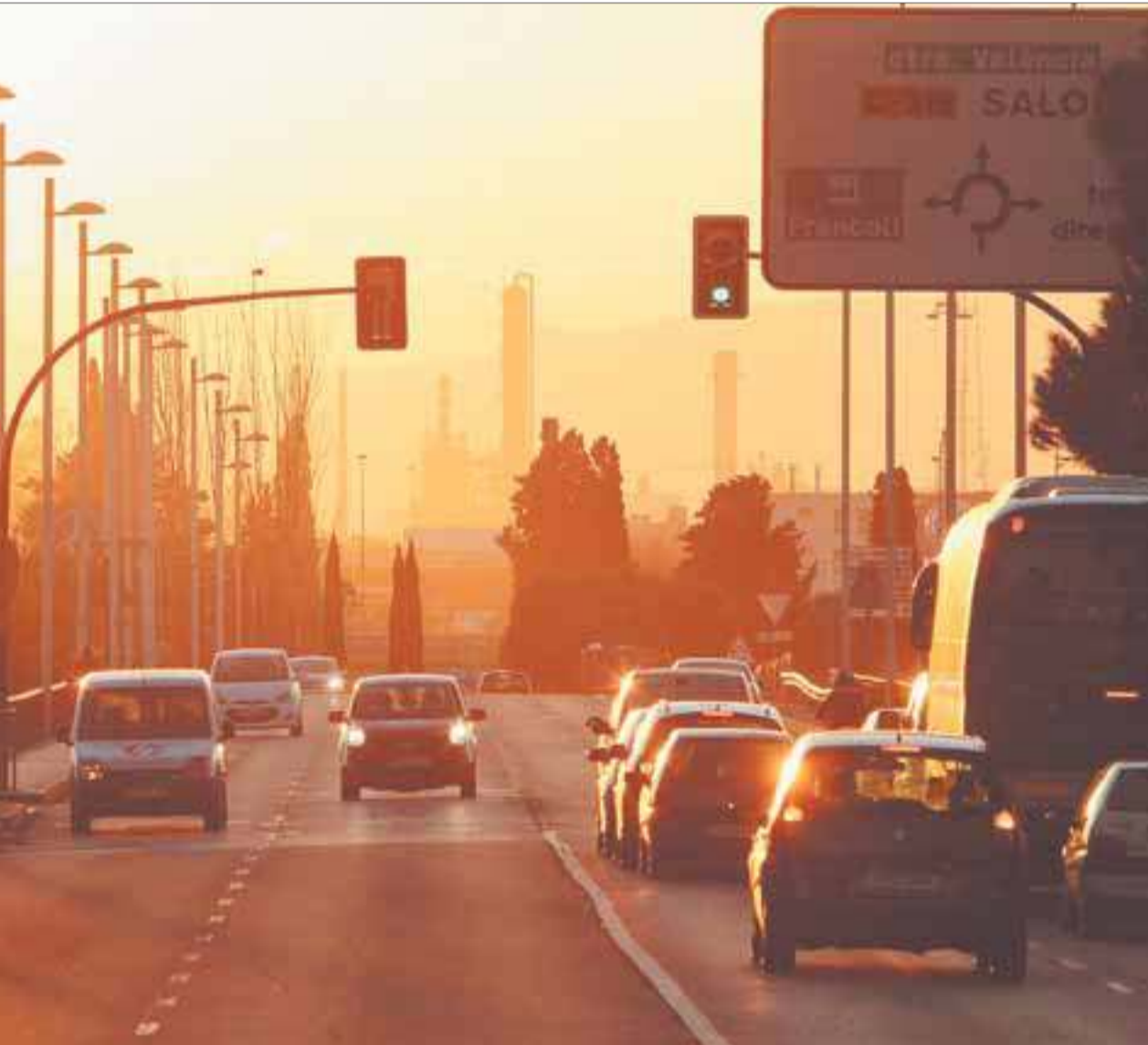
La Generalitat ha presentado este mes el Programa de Gestión de Recursos hasta 2020.

El nuevo plan de la Generalitat considera los residuos como recursos valiosos que reintroducidos en el ciclo pueden reducir la dependencia exterior de materias primas