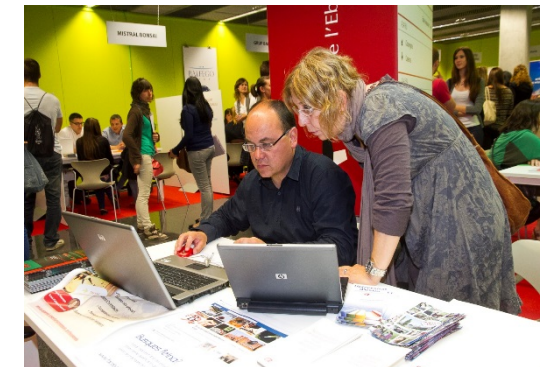
Oficina d'Orientació Universitària