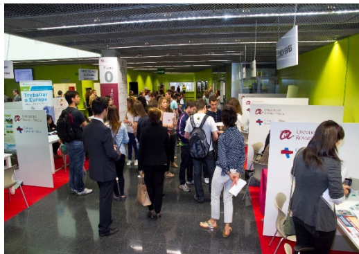
Occupació URV. Orientació Professional