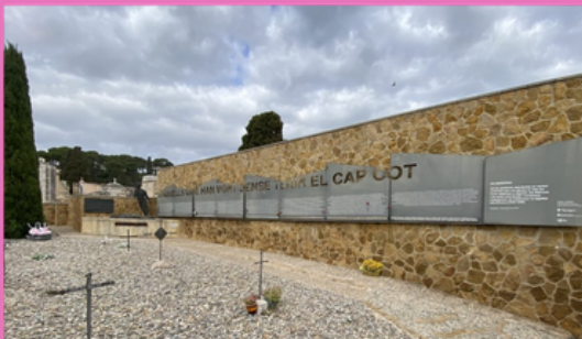
Cementiri de Tarragona