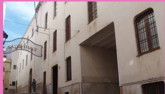
Convent de les Oblates