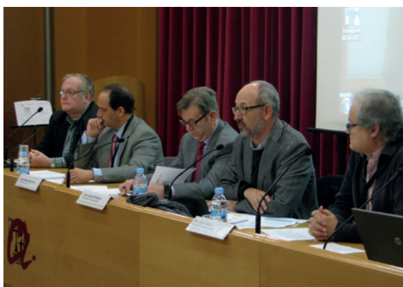
Inauguració del III Congreso Internacional de la Secah a l'Aula Magna de la URV.

Jornada de debat i reflexió sobre arqueologia clàssica i món antic Tants caps, tants barrets? Noves maneres de pensar el món antic avui i demà . Organitza l'ICAC, amb motiu del desè aniversari de l'Institut. Tarragona, 21 de novembre.