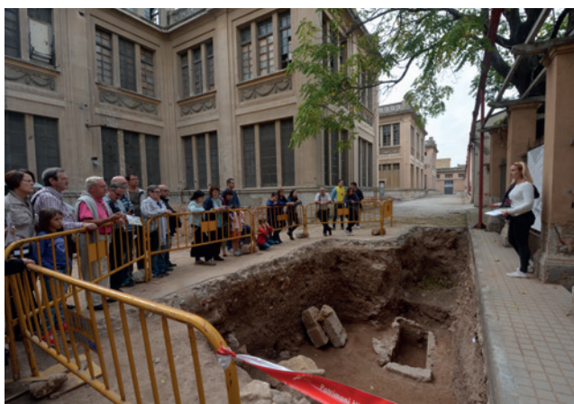
Jornada de portes obertes a la basílica paleocristiana de Sant Fructuós de Tarragona.

Jornada de portes obertes a la intervenció arqueològica a la Basílica de Sant Fructuós (Necròpolis Paleocristiana de Tarragona) . Organitzen l'Arquebisbat i l'Ajuntament de Tarragona, l'ICAC i l'Autoritat Portuària de Tarragona amb la col·laboració de l'ACSF i el MNAT. Tarragona, 2 de novembre.