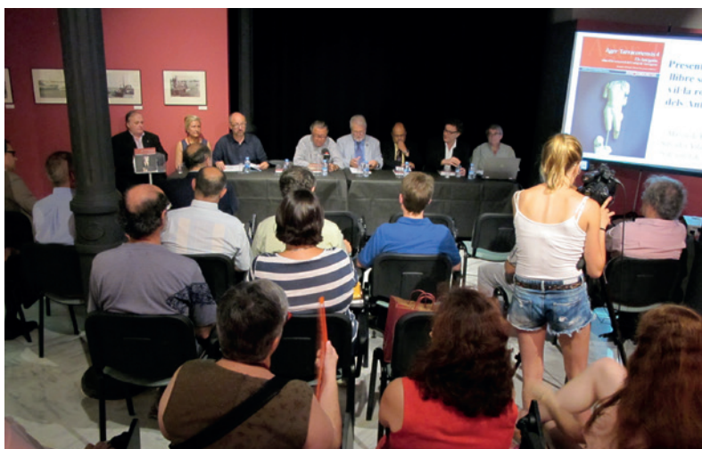
Presentació del llibre Ager Tarraconensis 4 al Museu de Reus - Salvador Vilaseca.