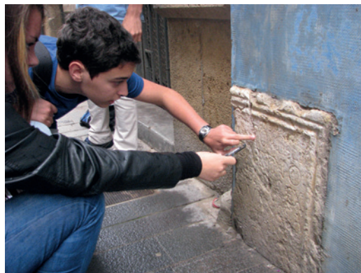
Alumnes del curs Bojos per l'Arqueologia! analitzant una inscripció.

Curs Bojos per l'Arqueologia! (2a edició del programa "Bojos per la ciència!"). Organitza la Fundació Catalunya-La Pedrera amb l'IPHES, l'ICAC i l'ICRPC, en el marc del programa SUMA. Tarragona i Girona, 18 de gener-13 de desembre.