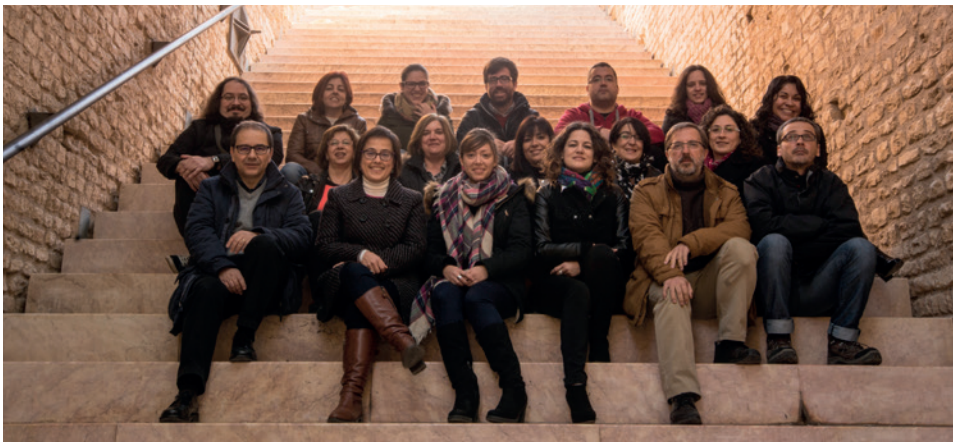
Personal de gestió i suport a la recerca a la capçalera del circ romà de Tarragona.