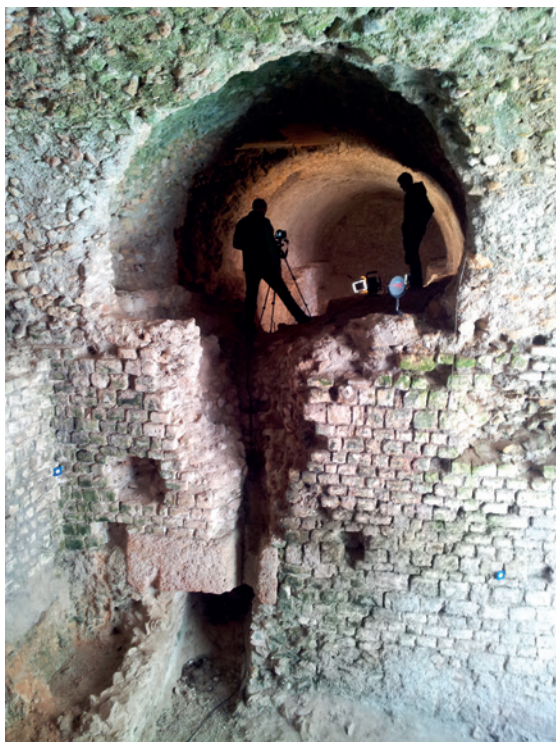
Documentació de l'interior de les voltes de la plaça dels Sedassos de Tarragona.

Paral·lelament, la UDG ha coorganitzat el curs "Làser Escàner i Multiestació en Arqueologia i Patrimoni", amb Leica-Geosystems, i el seminari "Noves tecnologies i documentació arqueològica", amb la col·laboració de Leica-Geosystems i el Col·legi d'Arquitectes de Tarragona.