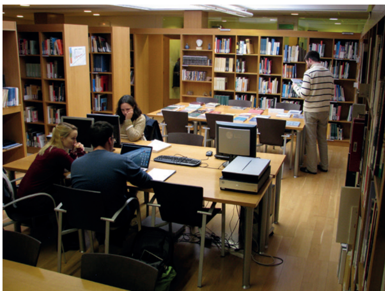
Biblioteca de l'Institut.