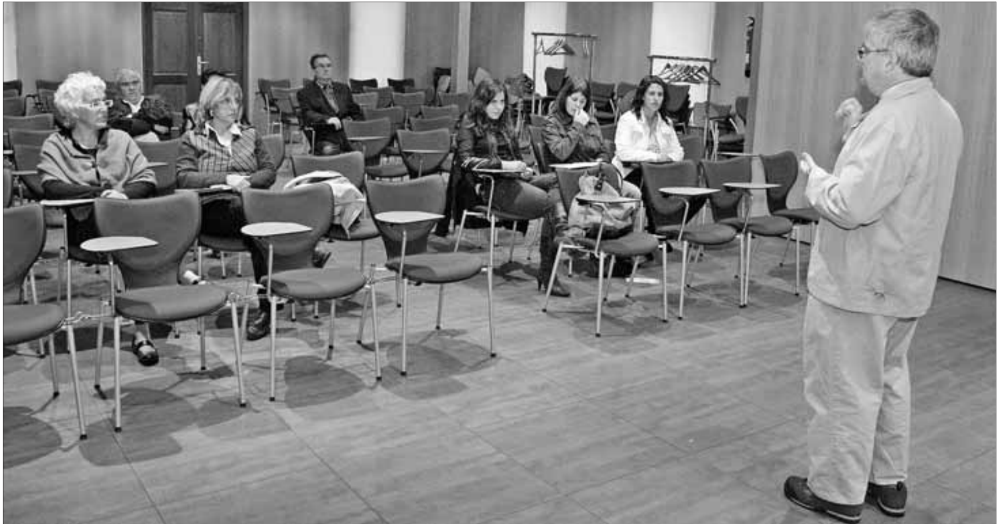
► Poques persones van assistir a un dels actes de clausura de les jornades que va tenir lloc el dissabte 10 de maig. Una mica de música i un aperitiu van posar el punt i final.