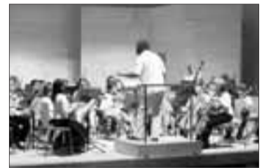
Actuació musical a Vila-seca. DT

20.30 hores. Música: Vespres musicals. Pau Baiges. Conservatori de Música de Vila-seca. Sala Pare Antoni Soler, Avinguda de la Gene-