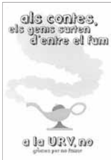
El cartell és obra de l'alumne Fernando Sanz.

Això sí que és art! Amb el NoBadis d'aquest mes volem introduir-nos en diverses disciplines artístiques, des de les obres plàstiques, musicals, noves tendències i moltes més propostes que no et deixaran indiferent. Coneix les creacions del nostre territori i treu-ne conclusions! PER XAVIER ZARAGOZA OLIVÉ