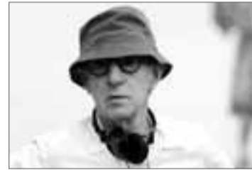
El cineasta Woody Allen.