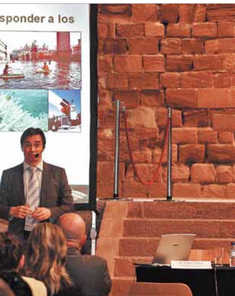
Ant la seva ponència a les jornades de Riudecanyes.

En aquests moments no hi ha cap centre més d'aquestes característiques a Catalunya, i també ens servirà per formar a futurs professionals en el sector. A l'Observatori hi treballarem des de meteoròlegs fins a estudiosos del canvi climàtic.