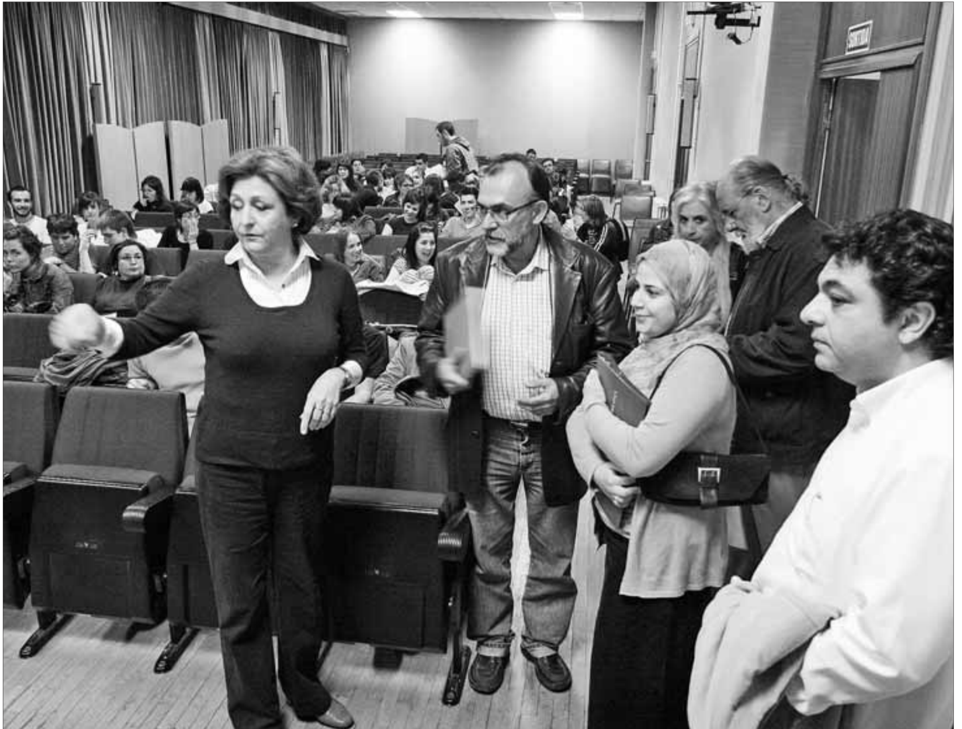
Imatge de la tercera i darrera Aula de Debat que es va celebrar a l'Aula Magna de la Facultat de Lletres de la Universitat Rovira i Virgili.

EDUCACIÓ ■ ELS ESTUDIANTS DE LA UNIVERSITAT HAN TRACTAT EL TEMA DE LA IMMIGRACIÓ A CATALUNYA I AL MÓN