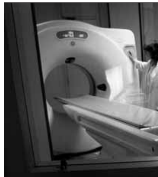
▶ Tomografia Axial Computeritzada o TAC, mètode de diagnòstic per la imatge.

En canvi, l'harmonia que s'ha mantingut al llarg de milers d'anys, en l'actualitat està alterada. En nom del progrés de la indústria, de la medicina, de la ciència en general i de la vida quotidiana, l'home ha anat utilitzant aparells i equips que generen camps magnètics estàtics, alterns de diferents freqüències, nivells d'inducció,