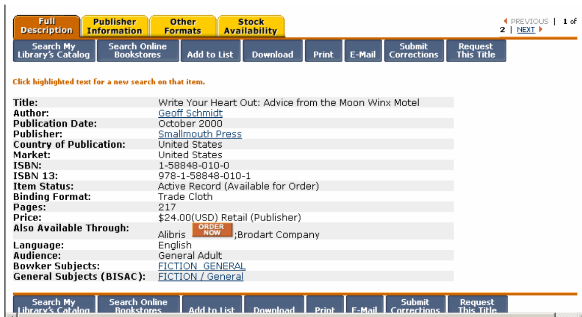
Fig. 4 Pàgina de descripció completa d'un llibre

Desde la pàgina de descripció completa dels títols seleccionats podem obtenir també informació sobre l’editorial, altres formats en què el document està disponible i la seva disponibilitat en el mercat.