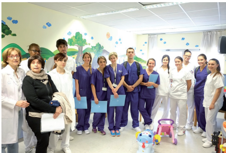
Estudiants d'Infermeria de la James Madison Univeristy (EUA) durant la visita a l'Hospital Joan XXIII, maig de 2014.