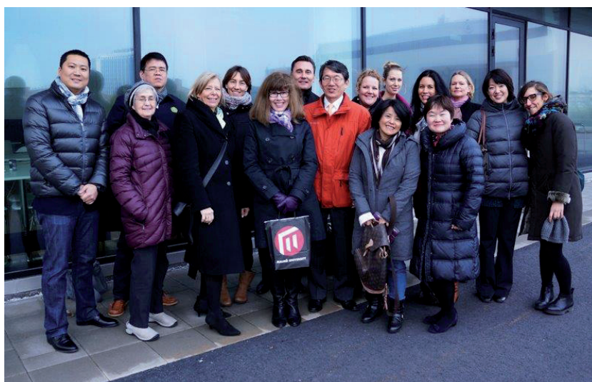
Council Meeting de l'INU a Malmö, Suècia, al març de 2014.

Organització de dos seminaris URV: un de Drets Humans i l'altre d'Infermeria, amb participació d'estudiants i professors de la universitats d'Hiroshima i de la URV, al març de 2014.