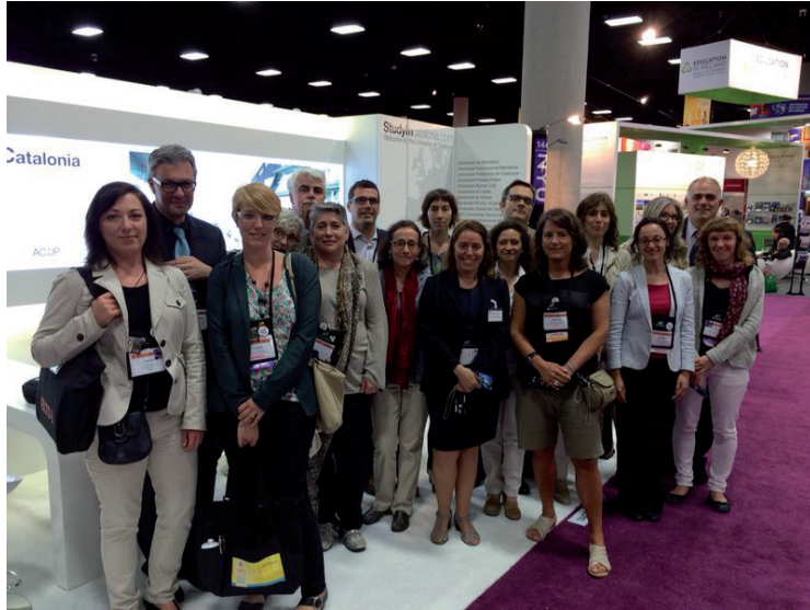
NAFSA a San Diego (EUA) al maig de 2014.

Finalment, cal esmentar la participació del rector en: