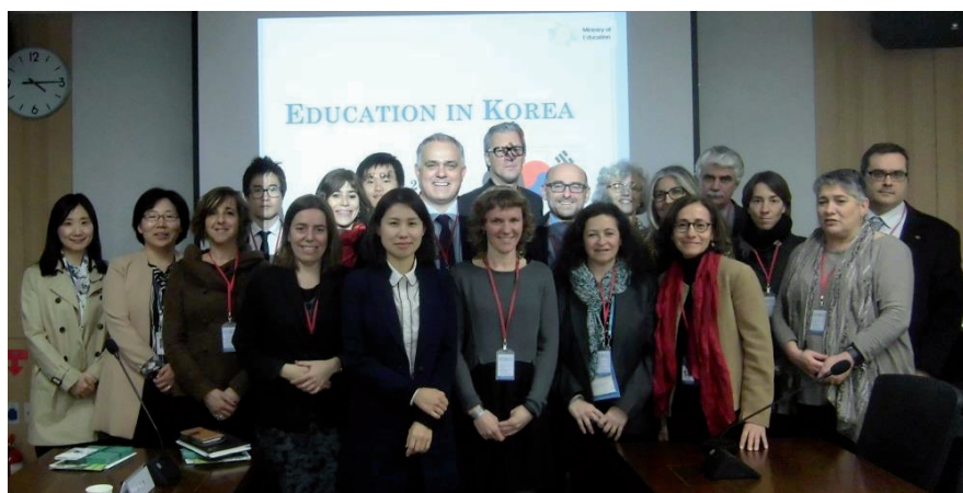
Conferència anual APAIE. Visita al Ministeri d'Educació a prop de Seül, al març 2014.