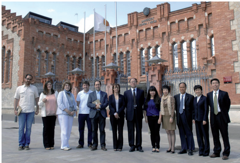
Delegació de la Shenzhen Polytechnic University el 10.10.2013